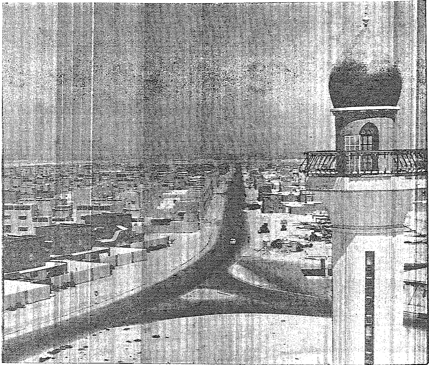
تحتفل إمارة البحرين في ١٢ تشرين الثاني القادم بفتح مدينة عيسى التوديعية بحضور الشيخ عيسى بن سلمان آل خليفة حاكم البحرين وتوابعها وسفير الإمارات لثلاثة أيام. وتبعد مدينة عيسى أربعة أميال عن مدينة الملمة (العاصمة) وتبلغ مساحتها جيلين ونصف الميل المربعة. وهي تضم ١٥٠٠ منزل والأرض التي تقوم عليها هبة من عظمة الحاكم